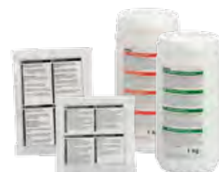
Entkalkungsmittel und Kaffeiansatzlösung